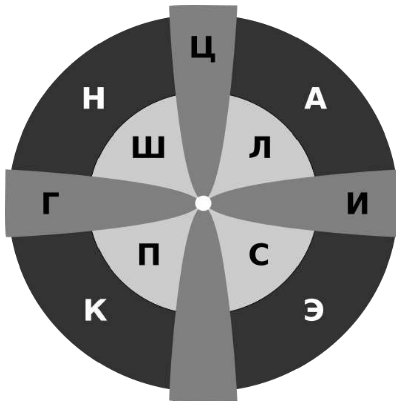
Рис. 2. Построенная диаграмма. Акцентуации обозначены первыми буквами их названий: К - конформный, Н - неустойчивый, А - астеноневротический, Э - эпилептоидный, Г - гипертимный, Ц - циклотимный, И - истероидный, Ш - шизоидный, Л - лабильный, С - сенситивный, П - психастенический.

бедствий, магнитных бурь и пр. Не способен к созданию ригидных интроектов, поэтому зависим от присутствия рядом с ним реальных ценных и заботящихся фигур.